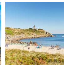
Les îles Chausey