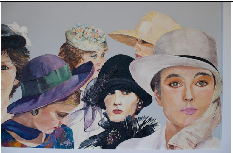
« Longchamp » (huile sur bois, œuvre d'Odile CARRE)

L'invitée d'honneur est la peintre Odile CARRE