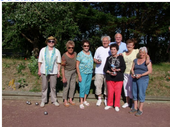
L'équipe « des boulistes » du Calvados

Cette dernière édition n'a pas attiré beaucoup de Calvadosiens. Des raisons certes à cela : la date choisie, un peu tardive et de plus coïncidant avec la fête de la musique mais aussi peut-être un désintéressement des jeunes actifs de nos associations départementales pour ce genre de rencontres pourtant si conviviales.