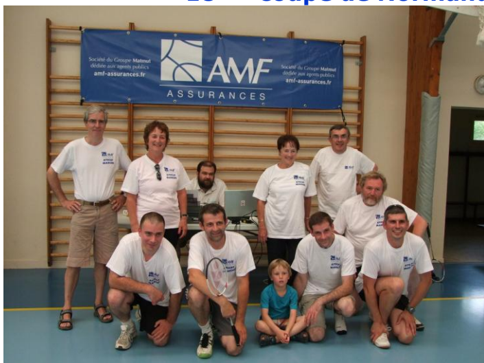
Les finalistes du Badminton avec les organisateurs