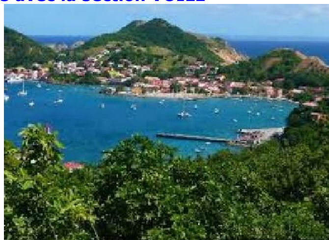
Baie principale des Saintes (sud Guadeloupe)

Pour cela, envoyez un mail à chr.liard@orange.fr en précisant le nom des participants, la période souhaitée, le type de bateau préféré et tout autre renseignement qui pourrait être utile.