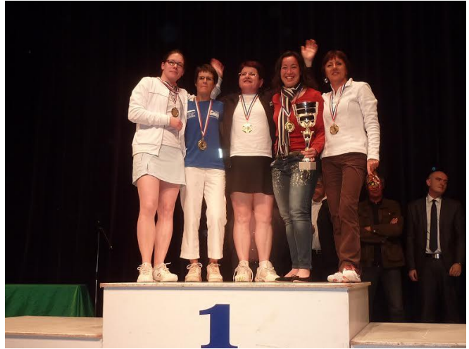
Le podium des finalistes à Vichy