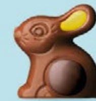
Praliné et riz soufflé