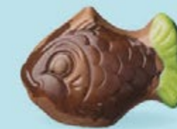
Praliné et noix de coco caramélisée