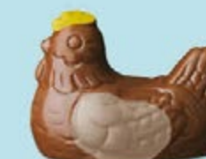
Duo praliné et ganache caramel