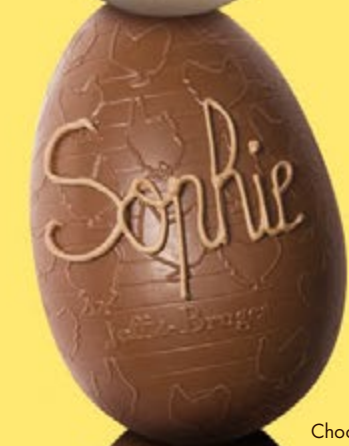
Chocolat au lait