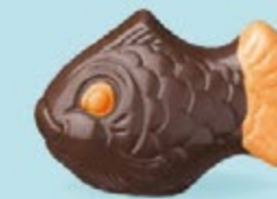
Praliné croustillant aux éclats de crêpe dentelle