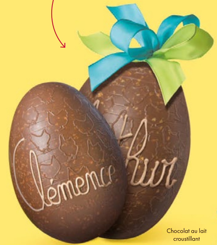
Chocolat au lait croustillant