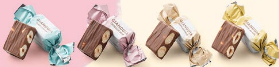
Chocolat au lait