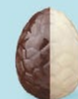
Praliné avec éclats de noisettes