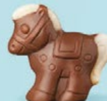
Praliné croustillant aux éclats de crêpe dentelle