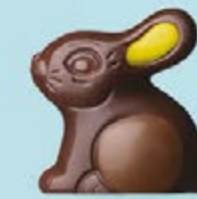
Praliné et éclats d'amandes caramélisées