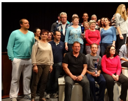
Notre délégation sur la 2 ème marche

La joie suprême : nous sommes 2ème au classement général.