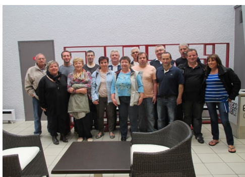
Nos marcheurs et coureurs