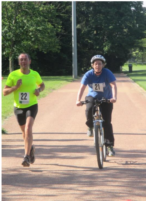
Le Run and Bike