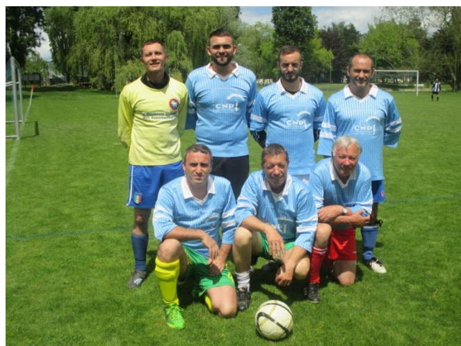
Les footballeurs sont en argent