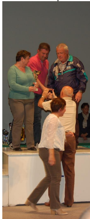
Le titre pour les Tireurs