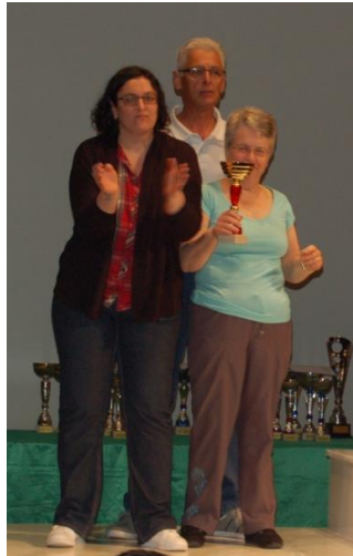
La seconde marche pour le bowling