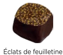
Éclats de feuilletine