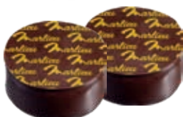
Ganache noir intense