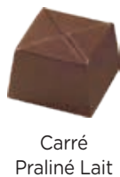
Carré Praliné Lait