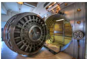
Dérobez le Diamant de la famille Léone!

Choix de l'aventure : 7 personnes par aventures - toutes programmées à 19h00