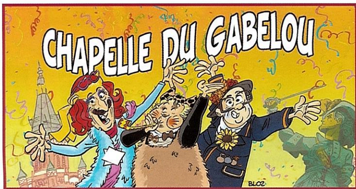
Logo Chapelle du Gabelou

Le secteur culture a exigé de notre part un coup de pouce. Afin de permettre au plus grand nombre d'accéder aux offres culturelles, l'ATSCAF Dunkerque subventionne la billetterie des cinémas et du Jazz club de Dunkerque, à la réputation nationale bien établie.