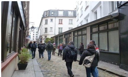
Nous étions nombreux à arpenter les multiples passages bien cachés