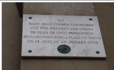
Un brin d'histoire concernant le cimetière de Picpus et les événements de la terreur http://www.parisinfo.com/musee-monument-paris/71410/Cimetière-de-Picpus ou http://fr.wikipedia.org/wiki/Cimetière_de_Picpus