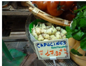
Au marché Aligre de magnifiques produits nous donnaient envie de passer en cuisine, avec des prix abordables et même des curiosités comme ces « capucines » sans oublier les produits dits exotiques