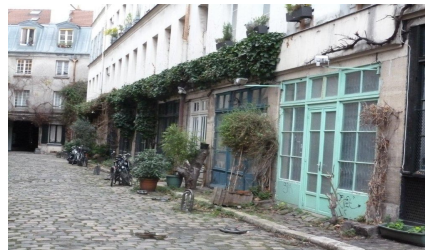
Ces passages tout en discrétion avaient un petit style campagnard