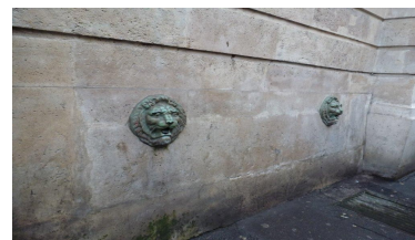
La fontaine nous permet de faire le lien avec la prochaine sortie qui nous mènera vers les Eaux de Belleville le dimanche 9 Février prochain