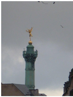
Le génie de la Bastille qui nous accompagna tout au long de cette matinée