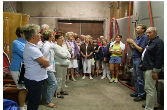
Un public attentif aux commentaires d'un viticulteur passionné