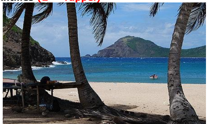
Baie principale des Saintes (sud Guadeloupe)

Il reste quelques places : inscriptions urgentes.