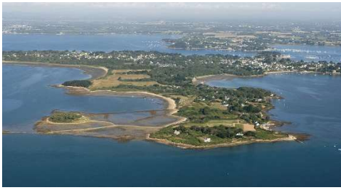
L'île aux moines

Visite de l'île, déjeuner au restaurant en bord de mer, Départ 15h pour l'île aux moines pour découvrir ses ruelles secrètes