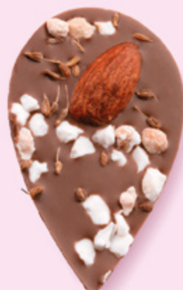
LE SONGE DE JULIETTE Chocolat au lait 35% de cacao, amande, éclats de nougat, brins d'anis