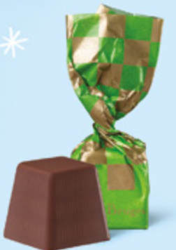
CHOCOLAT NOIR Praliné façon rocher aux éclats de noisettes