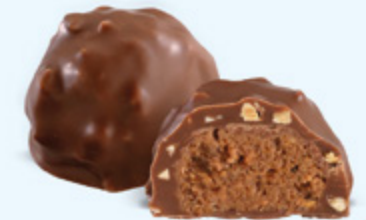
Praliné aux noisettes et éclats d'amandes, chocolat au lait 36% de cacao