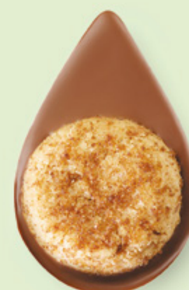
BISCUIT NOISETTES Chocolat au lait 35% de cacao

Un biscuit sablé artisanal posé sur un très bon chocolat ! C'est simple et c'est divin.