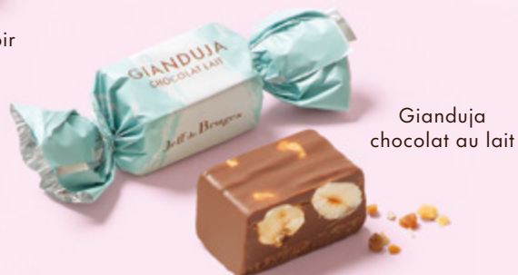
Gianduja chocolat au lait