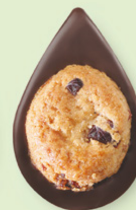
BISCUIT CRANBERRIES Chocolat noir 60% de cacao