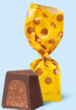
CHOCOLAT NOIR Praliné avec éclats de crêpe dentelle

BOITE DE 245 G NET 19 SUJETS ASSORTIS AU PRALINÉ 7 RECETTES