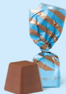
CHOCOLAT AU LAIT Praliné et sucre pétillant