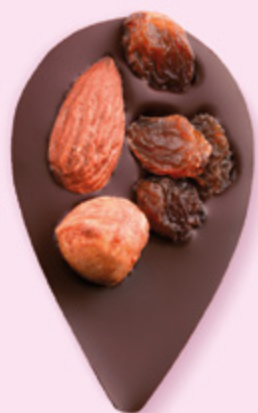
JULIETTE IN THE CITY Chocolat noir 60% de cacao, amande, noisette, raisins secs