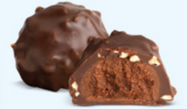
Praliné aux noisettes et éclats d'amandes, chocolat noir 60% de cacao