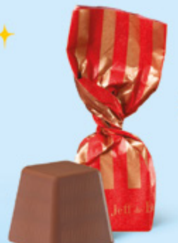
CHOCOLAT AU LAIT Praliné noisettes façon pâte à tartiner