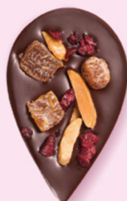
JULIETTE & TOM Chocolat noir 60% de cacao, dés d'abricots secs, amandes caramélisées et morceaux de cerise