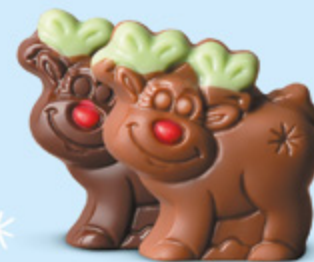
Praliné et éclats de noisettes torrifiées ou praliné et éclats de crêpe dentelle