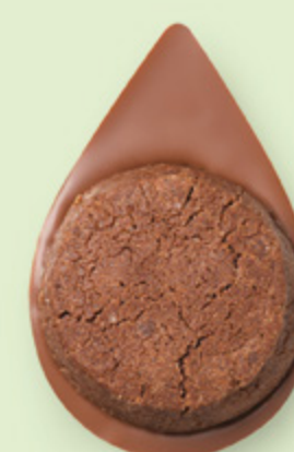
BISCUIT BROWNIE Chocolat au lait 35% de cacao

Les prix barrés sont les prix de vente TTC maximum en boutique. *Prix de vente TTC maximum.