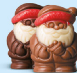
Duo praliné et caramel ou praliné et éclats de noisettes caramélisées