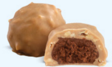
Praliné aux noisettes et éclats d'amandes, chocolat blanc caramélisé