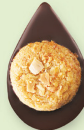
BISCUIT AMANDES Chocolat noir 60% de cacao