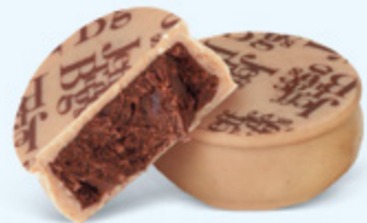
Ganache aromatique de chocolat noir au cacao d'Équateur, chocolat blanc caramélisé