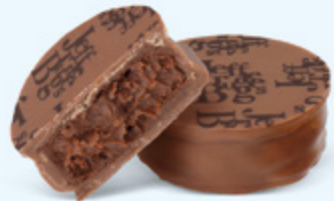
Ganache de chocolat noir au cacao fruité de Saint-Domingue, chocolat au lait 36% de cacao