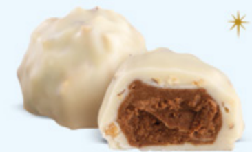
Praliné aux amandes et éclats d'amandes, chocolat blanc