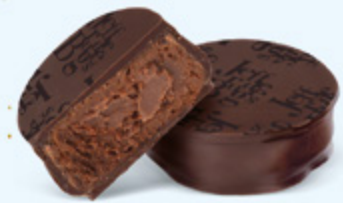
Ganache corsée de chocolat noir au cacao du Venezuela, chocolat noir 70% de cacao

Venezuela, Saint-Domingue, Équateur, Sao Tomé... Une invitation au voyage vers les plus fameuses origines de cacao.