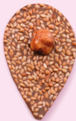
GRAINE DE JULIETTE Chocolat au lait 35% de cacao, sésame, noisette caramélisée