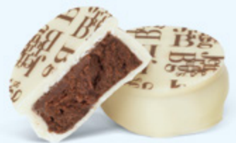
Puissante ganache de chocolat noir au cacao de Sao Tomé, chocolat blanc

BOITE DE 250 G NET 24 PALETS ASSORTIS 4 RECETTES