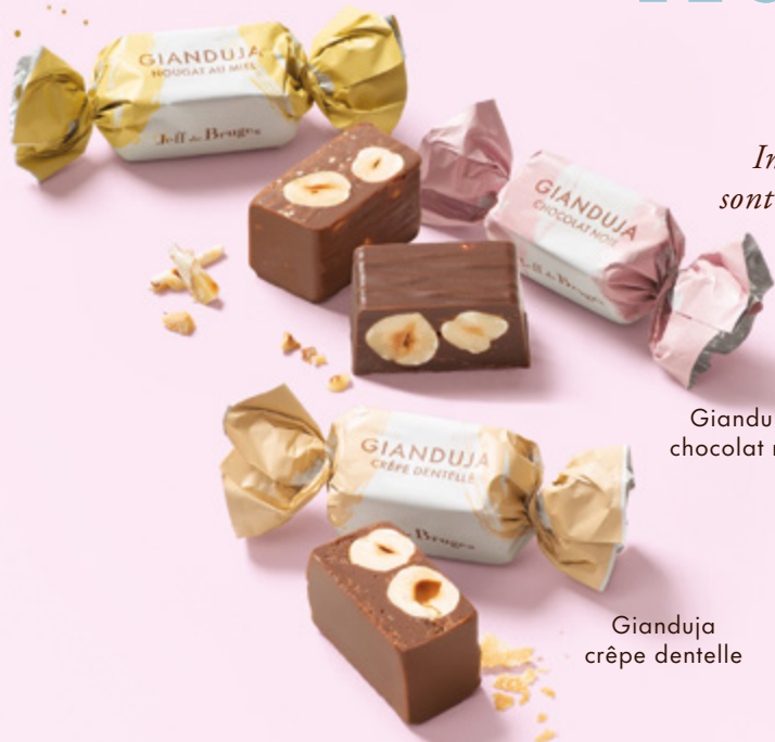
Gianduja chocolat noir