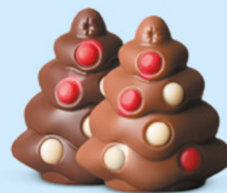
Praliné et sucre pétillant ou praliné et éclats de nougat

Nos choco'pralinés font partie de la magie de Noël. Ils plaisent aux petits... comme aux grands !