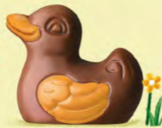
Praliné avec sucre pétillant