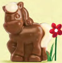
Moelleux au chocolat