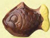
Praliné et noix de coco caramélisée