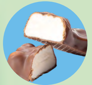
Un cœur tendre en guimauve enrobé de chocolat au lait