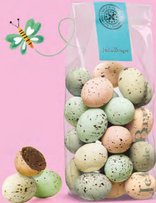
Praliné tendre ou praliné et éclats de crêpe dentelle