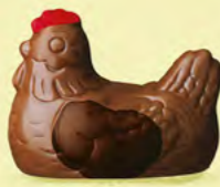
Duo praliné et ganache caramel