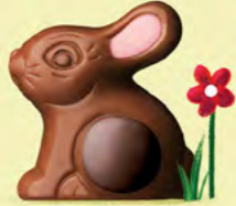
Praliné et riz soufflé