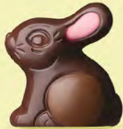
Praliné et éclats de noisettes caramélisées

NOS petits animaux en chocolat sont "presque" trop mignons pour être croqués !