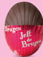
Praliné et éclats de noisettes caramélisées