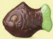
Praliné croustillant aux éclats de crêpe dentelle