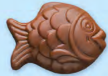
Chocolat au lait 36% de cacao

LA BOITE DE FRITURES EN CHOCOLAT ASSORTIES 220 G