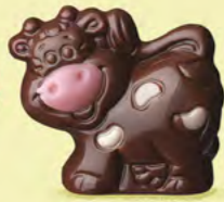
Praliné avec sucre pétillant