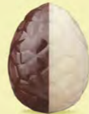
Praliné avec éclats de noisettes