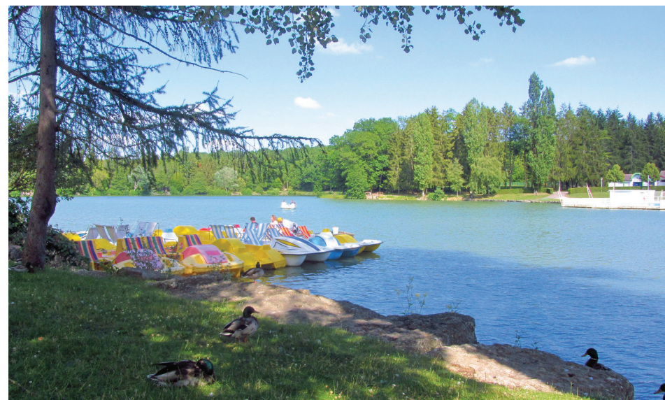
Pédalos sur le lac